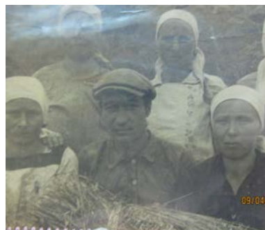
на фото: в середине-папа, справа -мама

Радио-то в селе не было, поэтому о войне узнали на второй день, когда приехали из Азаматова представители районного сельсовета и вместе с почтой привезли повестки.